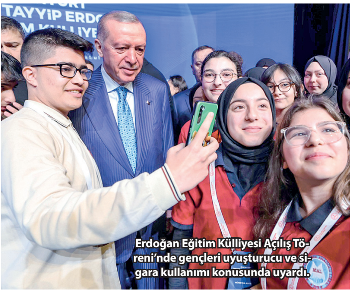
Erdoğan Eğitim Külliyesi Açılış Töreni'nde gençleri uyuşturucu ve si-gara kullanımı konusunda uyardı.