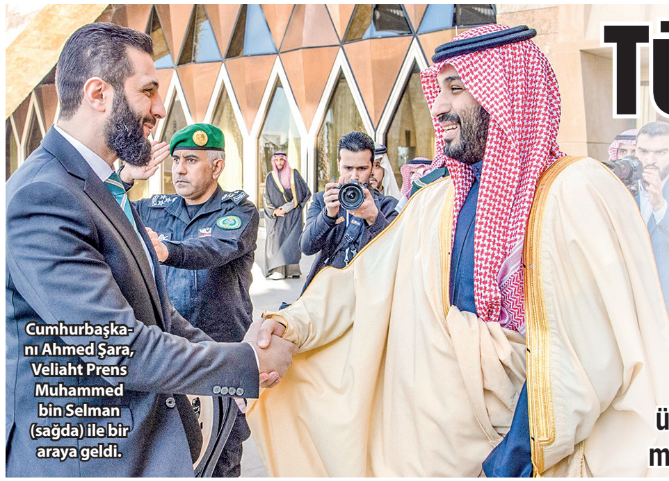
Cumhurbaşkanı Ahmed Şara, Velihaht Prenis Muhammed bin Selman (sağda) ile bir araya geldi.

KADEM Mütevelli Heyeti Başkanı Sümeyye Erdoğan Bayraktar, vakfın Kahramanmaraş'ın yanı sıra Hatay, Adıyaman ve Malatya kadın destek merkezlerinin faaliyette olduğunu belirterek, "Şu ana kadar bu bölgede 7 bin 101 kadına hizmet verdik." dedi. Sayfa 9