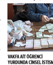
VAKFA AIT ÖĞRENCİ YURDUNDA CİNSEL İSTİSMAR

Adana Cumhuriyet Başsavcılığı tarafından yürütülen 'suç örgütü' soruşturması kapsamında operasyon yapılan Furkan Eğitim ve Hizmet Vakfı'na ilgili yeni bir skandal ortaya çıktı. Vakfın temsilcilerine ait bir erkek öğrenci yurdunda, 3 erkek öğrenciyi cinsel istismarda bulunan bir matematik hoca ile olayı anlatan öğrencilerin söylediklerini polise bildirmeyen yurt yöneticilerinin tutuklanıp ceza aldıkları ortaya çıktı.