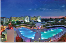
Kazdağları - Edremit / BALIKESİR