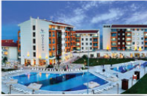
Güdül / ANKARA