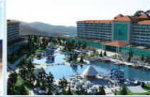
Havza / SAMSUN