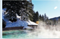
Göynük / BOLU