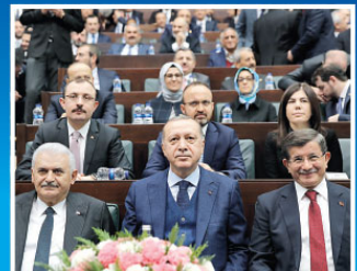
Cumhurbaşkanı Recep Tayyip Erdoğan ve eski Başbakan Ahmet Davutoğlu'nun dün AK Parti grup toplantısında birlikte gelmesi ve Başbakan Binali Yıldırım ile Davutoğlu'nun birlikte oturması, günün dikkat çeken karesi oldu.

CUMHURBAŞKANI Erdoğan, "Münbiç'ten çekilmeyeceğiz" açıklaması yapan ABD Merkez Kuvvetler Komutanı Joseph Votel başta olmak üzere operasyonun kapsam ve süresinin sınırlı olmasını isteyen çevrelere net mesajlar verdi. Erdoğan, "Sınırlarımızdaki terör tehdidi tamamen ortadan kalkana, Suriyeli kardeşlerimiz kendi evlerine güven içinde dönene kadar durmayacağız. Yanlarında kimin olup olmadığına bakmaksızın teröristlerin üzerine gitmeye devam edeceğiz." dedi. Sayfa 10