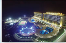
Erzin / HATAY