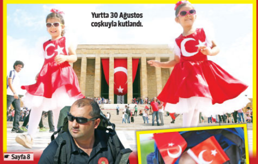
Yurtta 30 Ağustos coşkuyla kutlandı.

'CANIMIZ PAHASINA SAHİP ÇIKACAĞIZ' ERDOĞAN, Anıtkabir Özel Defteri'ni imzalararak, "16 Temmuz gecesi sergilenen destansı direniş, ülkemizin ekonomik ve siyasi bağımsızlığına yönelik tüm saldırılara bertaraf etme konusundaki kararlılığını ortaya koymuştur. Sizin, aziz şehitlerimizin ve kahraman gazilerimizin bizlere emaneti olan bu vatana olanımız pahasına sahip çıkmayı sürdüreceğiz." ifadelerini kullandı.