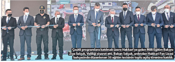
Çeşitli programlara katılmak üzere Hakkari'ye gelen Milli Eğitim Bakanı Ziya Selçuk, Valiliği ziyaret etti. Bakan Selçuk, ardından Hakkari Fen Lisesi bahçesinde düzenlenen 35 eğitim tesisinin toplu açılış törenine katıldı.