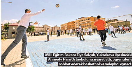
Milli Eğitim Bakanı Ziya Selçuk, Yüksekova ilçesindeki Ahmedî Hani Ortaokulunu ziyaret etti, öğrencilerle sohbet ederek basketbol ve voleybol oynadı.

Kentte 35 eserin açılışını yapacaklarını anmsatan Selçuk, çocukların daha güzel, yeni binalarda okuması ve güzelliğini, öğretmenlerin daha iyi şartlar bulunan mekamlarda çalışmasını, çok daha mutlu olmasını istediklerini vurguladı. Hakkari'yi uzaktan eğitim sürecinde elde ettiği başarıdan dolayı tebrik eden Selçuk, şunları kaydetti: "Herhangi bir ilimizdeki Artvin'deki, Mersin'deki ya da Burdur'daki faaliyetler neyse buradaki faaliyetler de oradan