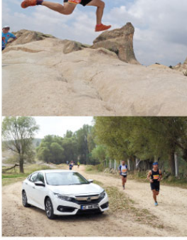
Outdoor Fitness Dergisi ekibi de Honda Civic'in LPG'li modeli ile Frig Vadisine gitti ve çöp toplama etkinliğine katıldı. Honda Civic'in LPG'li modeli çevreye ekolojik özellikleriyle ön plana çıkıyor...

NG Afyon'un desteğiyle bu yıl 5.si düzenlenen Frig Ultra Maratonu birincileri belli oldu. Geçtiğimiz haftalarda gerçekleştirilen maratona yerli yabancı toplam 700 sporcu katıldı. Frig Vadisi'nin kültürel değerine dikkat çekmemişiyorum da bulunan Frig Ultra Maratonu, 9K, 23K ve 54K olmak üzere 3 özel parkurda gerçekleşti. NG Hotels'in bu yıl ikinci Sapanca'da gerçekleştirildiği çevre temizlik hareketi Plogging - Koşarken Çöp Toplama Frig Ultra Maratonu'nda da uygulanarak, sporcular hem koştu hem de çöp topladı... Bölge değerlerinin gelişimine verdiği desteklerle bilinen NG Afyon'un ana sponsorluğunda ve Limit Sensim iş birliğiyle bu yıl 5.si düzenlenen Frig Vadisi Ultra Maratonu'nda ilk kez düzenlenen Afyonkarahisar Kale Yarışını'nda yerli ve yabancı olmak üzere yaklaşık 700 sporcu ter döktü. Bu yıl Sapanca Ultra Maraton'la büyük bir farkındalık yaratan, işveç'te başlayan ve sosyal medya sayesinde dünyaya yayılan "Plogging-Koşarken Çöp Topla" trendi Sapanca'dan sonra Frig Ultra Maraton'da da hayata geçirildi. Maraton katılımcılarının içerisinde verilen çöp poşetleriyle belirli noktalarda durarak hem doğayı korudular hem de tarihin izletini keşfettiler.