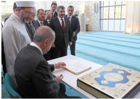
Türkiye Cumhurbaşkanı Recep Tayyip Erdoğan, Almanya'nın Köln kentinde Diyanet İşleri Türk İslam Birliği (DİTİB) Merkez Camisi'nin açılış törenine katıldı.

Bugüne kadar en fazla zarar Müslümanlara vermiş, en çok Müslüman kanı dökmüş terör örgütleri İslamist ve cihadist gibi ifadelerle yine Müslümanlara yananmak isteniyor. Her fırsatta ifade ettiğim bir hususu burada tekrarlamak istiyorum: Adı, iddiası, ideolojisi ne olursa olsun, teröre buluşan, şiddete buluşan, Müslümanların canına kasteden hiçbir yapının İslam'la, Müslümanlıkla, İslam'ın insanımızla bağı yoktur."