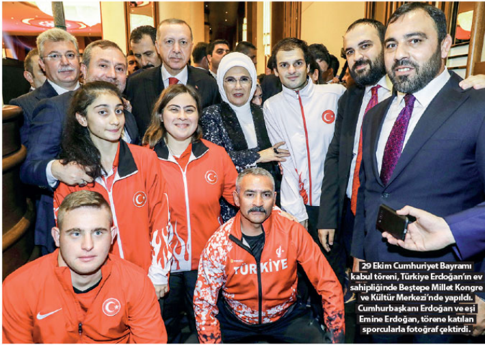
29 Ekim Cumhuriyet Bayramı kabul töreni, Türkiye Erdoğan'ın ev sahipliğinde Beştepe Millet Kongre ve Kültür Merkezi'nde yapıldı. Cumhurbaşkanı Erdoğan ve eşi Emine Erdoğan, törene katılan sporcularla fotoğraf çekti.

"Türkiye'den başka her kim Suriye meselesinde derdinin insan hakları, masumların canı, Suriye halkının geleceği olduğuna iddia ediyorsa, açık konuşuyorum yalan söylüyor. Bizden başka Suriye ile ilgilenen herkesin öncelikli amacının petrol kaynaklarını kontrol etmek olduğu, şu son iki haftalık süreçte bir kez daha ortaya çıkmıştır. Bir damla petrolü bir damla kandan daha değerli gören ilkel anlayış tüm çplaklığıyla karşımızda durmaktadır. Özellikle Suriye, bölgeyle ilgili hesabı olan güçlerin mücadelesinde alan ve pazarlık malzemesi haline dönüşmüştür. Suriye'ye baktığında petrol veya güç temerküzü fırsatı değil de sadece insan gören, sadece