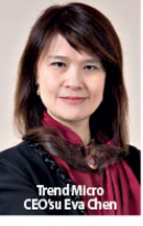
Trend Micro CEO'su Eva Chen