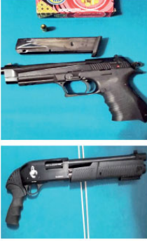
İSTANBUL VALİLİĞİ YAKINLARINDA PARK ETMİŞLER