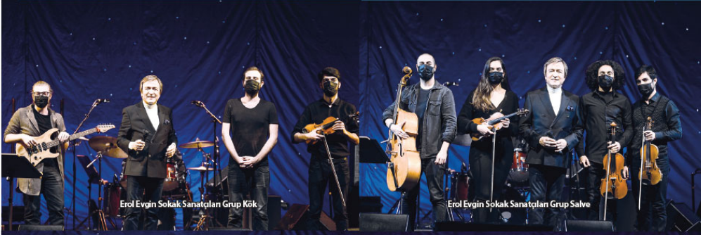
Erol Evgin Sokak Sanatçıları Grup Kök