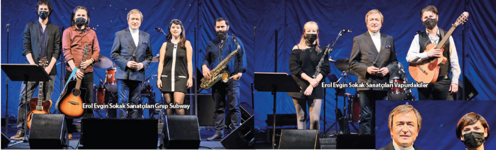
Erol Evgin Sokak Sanatçıları Grup Subway