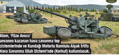
Atom, 'Föze Avoisi' unvanını kazanan hava savunma top sistemlerinde ve Kundadji Motorlu Namılı Algaç İrtifa Hava Savunma Silah Sistemi'nde (Korkut) kullanılıyor.

GELİŞTİRİLMİŞ parçacık sağlına sahip Atom, 4 kilometre etekli menzile, elektromanyetik kanırtmaya karşı dayanıklı görev yapıyor. Atom'un görevlere yönelik 3 farklı versiyonu bulunuyor. 10