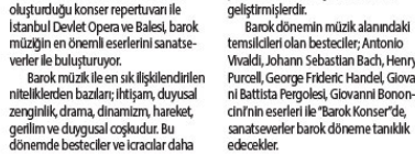
İstanbul Devlet Opera ve Balesi, 3 ve 15 Şubat akşamları "Barok Konseri" ile Kadıköy Süreyya Operası Sahnesi'nde olacak.

2 Şubat 2022 Çarşamba Saat 20:00 - Kadıköy Belediyesi Süreyya Opera Sahnesi