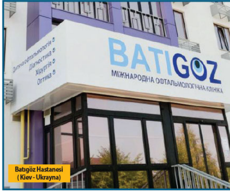
Batigoz Hastanesi (Kiev - Ukrayna)