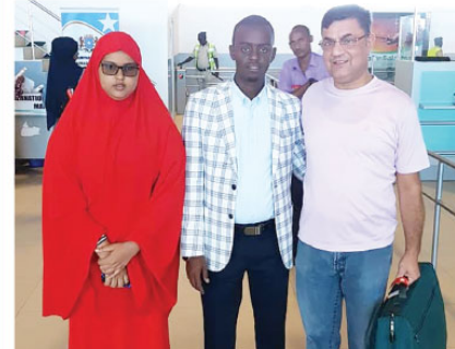
YARIN: Sağlık Bakanlığı'nın TİKA'yla birlikte yurt dışında açtığı hastaneler

Yurt dışında yeni yatırım planlarımızın hedefinde Afrika ve ABD var. Sağlık hizmetinin pahalı olduğu Amerika'da özellikle düşük bütçeli tedavileri sunarak hastalar için iyi bir alternatif olma potansiyeli var. Afrika'da benzer düşük bütçeli tedavi planı uygulayacağız. Yatırım yaptığımız ülkelere yaşayan Türkler, hasta portföyümüzün önemli bir bölümünü oluşturuyor. Ancak ülke ve çevresinde yaşayan hastalara da hizmet sunuyoruz. Ulaşım ve iletişimin bu kadar kolaylaştığı günümüzde artık sağlık adına ülke sınırlarının ortadan kalktığı düşünülüyor. Dış, göz ve estetik tedaviler gibi tüp bebek de sınır dışı hasta kazanabileceğimiz bir konumdadır.