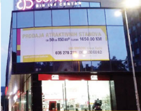
Bahçeci Tüp Bebek Merkezi (Tuzla - Bosna-Hersek)