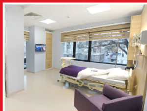
Bahçeci Tüp Bebek Merkezi (Sarejova - Bosna-Hersek)