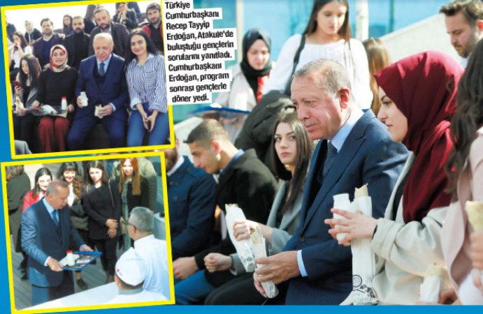
Türkiye Cumhurbaşkanı Recep Tayyip Erdoğan, Ankara'da bulunan gençlerin sorunlarını yanıtladı. Cumhurbaşkanı Erdoğan, program sonrası gençlerle döner yedi.

Cumhurbaşkanı Erdoğan, döviz kurundaki dalgalanmaya ilişkin, "Tüm bunlar Batı'nın, başta Amerika'nın, Türkiye'yi sıkıştırma operasyonlarıdır. Bunların hepsi şu anda Türkiye seçime giderken bir siyasi dayattır." dedi.