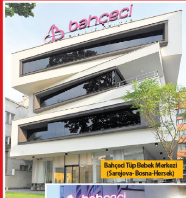
Bahçeci Tüp Bebek Merkezi (Sarejova - Bosna-Hersek)

Inovasyonun da merkezde İngiltere piyasasında bir tüp bebek merkezi açmayı hedefledik. Burayı bir yıl içinde faaliyete geçirmeyi planladık. Görüşmelerimiz son aşamaya geldi, imzayı atmak üzereyiz. Hedefimiz İngiltere'nin farklı bölgelerinde bir zincir yaratmaktır. Bir Türk markası olarak bunu yapacak olacağız biz gurur veriyor. Grubumuz genelinde 500'e yakın çalışmamız var. Bunların yansını yurtdışında istihdam etmekteyiz. Çalışanlarımız yüzde 70'i yöneticilerimiz ise yüzde 65'i kadınlardan oluşuyor. Yurt dışı ve yurtdışındaki bütün kliniklerimizde kendi yetiştirdiğimiz Türk hekimler ile çalışıyoruz. Yurtdışındaki merkezlerimizde 25 kişilik bir hekim kadromuz ve diğer birimler destek veren hemşireler ile beraber yaklaşık 80 civarında hemşiremiz mevcut.