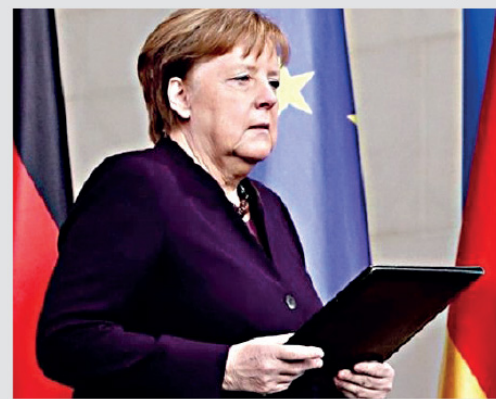
lanmayacak. "ALMAN HÜKÜMETİ İÇİN BÜYÜK BİR SINAMA"

Hırvatistan'ın mevcut AB Konseyi başkanlığına saygı için Almanya'nın AB Konseyi başkanlığı için ulusal programı, 30 Haziran'a kadar yayım-