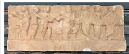
Ataşehir'de evin bahçesinde tarihi eser bulundu