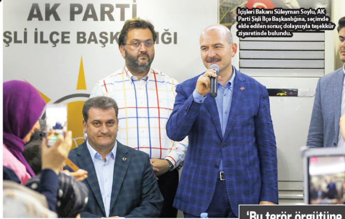
İçişleri Bakanı Süleyman Soylu, AK Parti Şişli İlçe Başkanlığına, seçimde elde edilen sonuç dolayısıyla teşekkür ziyaretinde bulundu.