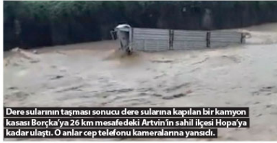
Dere sularının taşması sonucu dere sularına kapılan bir kamyon kasası Borçka'ya 26 km mesafedeki Artvin'in sahil ilçesi Hopa'ya kadar ulaştı. O anlar cep telefonu kameralarına yansıdı.