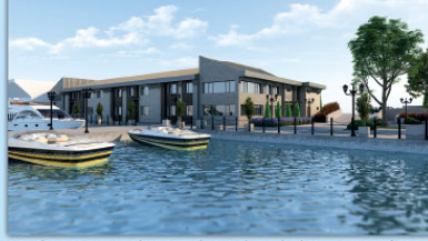
ŞEHİR HATLARI HİZMET BİNASI İDARI BİNA PROJESİ,2019

İSTANBUL BÜYÜKŞEHİR BELEDİYESİ-BİMTAŞ AŞ.