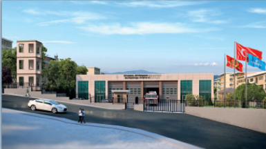
BAYRAMPAŞA ALTINTEPSİ İTFAİYE İSTASYONU PROJESİ,2015

İSTANBUL VALİLİĞİ-YATIRIM VE İZLEME MÜDÜRLÜĞÜ