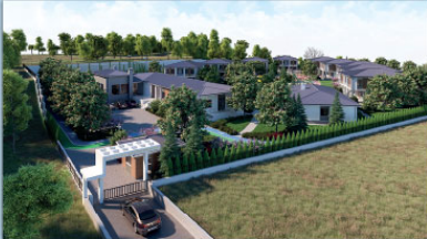
SANCAKTEPE SEVGİ EVLERİ PROJESİ,2018

BAYRAMPAŞA BELEDİYESİ-FEN İŞLERİ MÜDÜRLÜĞÜ