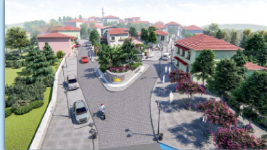
KURDOĞMUŞ KÖYÜ KALKINDIRMA FİKİR PROJESİ ,2018

İSTANBUL BÜYÜKŞEHİR BELEDİYESİ-BİMTAŞ AŞ.