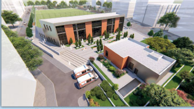
GÜNGÖREN ŞEHİT CANIK PARKI YANI ZEMİN ALTI OTOPARK VE SPOR TESİSİ PROJESİ,2017

İSTANBUL BÜYÜKŞEHİR BELEDİYESİ-BİMTAŞ AŞ.