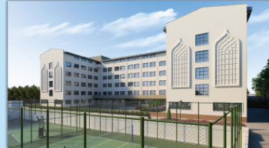
PENDİK YURT PROJESİ,2019

İSTANBUL BÜYÜKŞEHİR BELEDİYESİ-BİMTAŞ AŞ.