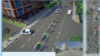
TUZLA DERSAİDİT CADDESİ DÜZENLEME PROJESİ,2016

İSTANBUL VALİLİĞİ-ÇEVRE VE ŞEHİRCİLİK İL MÜDÜRLÜĞÜ