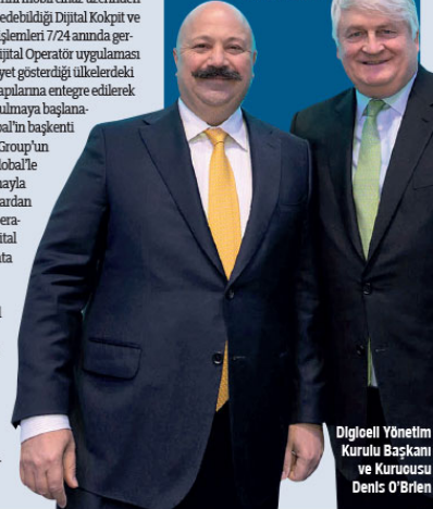
Digicel Yönetim Kurulu Başkanı ve Kurucusu Denis O'Brien

Turkcell'in 2018 yılı gelirlerinde yüzde 49 oranında büyük artışın en önemli etkenlerinden biri de Turkcell'in Dijital Operatör stratejisi oldu. Turkcell'in aktif dijital servis abone sayısı 69 milyona ulaşırken, aktif dijital abone sayısı da ilk defa bu yıl açıklanmış oldu. Turkcell'in gelirleri 2018 yılında 21,3 milyar TL'ye ulaşırken, FAVÖK ise yüzde 90,2 artış ile 8,8 milyar TL olarak açıklandı. Müşterisiyle ilişkisini 1440 dakikaya taşımak isteyen Turkcell'in abonelerinin aylık data kullanımını 7,6 GB'a ulaştı. Lifecell servislerini müşterilerine sunmaya başlayan operatörler, Turkcell'in bütçesine de yansıtıldı üzere ARPU'da pozitif tırmanış ve aynı zamanda müşteri bağlılığında artış denimleyecek.