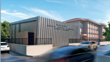
FLORYA MURAT KÖLÜK İLKOKULU SPOR SALONU PROJESİ,2016

SULTANGAZI BELEDİYESİ-PLAN VE PROJE MÜDÜRLÜĞÜ