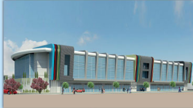
PENDİK KAYNARCA SPOR KOMPLEKSİ PROJESİ,2013

İSTANBUL BÜYÜKŞEHİR BELEDİYESİ-BİMTAŞ AŞ.