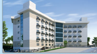
CUMHURİYET MAHALLESİ YAŞLI BAKIM MERKEZİ PROJESİ,2017

İSTANBUL BÜYÜKŞEHİR BELEDİYESİ-BİMTAŞ AŞ.