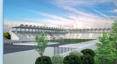
BÜYÜKÇEKMECE ULUS MAHALLESİ TRIBÜN PROJESİ,2017

PENDİK BELEDİYESİ-PLAN VE PROJE MÜDÜRLÜĞÜ