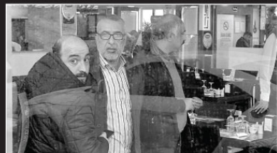
Antalya'dan ev almak için internet üzerinden tanıştığı kişilerle restorant'ta bir araya gelen İranlı Turist (Gözüldü), hiç görmediği evin pazarlığında 70 bin lirasını dolandırıcılara kapırdı.

Antalya'dan ev almak için internetten tanıştığı kişilerle restoranda bir araya gelen İranlı turist, hiç görmediği evin pazarlığında 70 bin lirasını dolandırıcılara kapırdı.