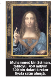
Muhammed bin Selman, tabloyu 450 milyon 300 bin dolarlık rekor fiyata satın almıştı.

Ama şimdi de Muhammed bin Selman'ın Da Vinci'ye mal edilen tabloyu Birleşik Arap Emirlikleri (BAE) Velihaht Prensi Muhammed bin Zayid'in Topaz isimli yatıyla takas edeceğine dair iddialar Arap basınına yansdı. 147 metre uzunluğunda olan ve 26 yatak odası bulunan Topaz isimli yatın değerinin de 450 milyon dolar civarında olduğu tahmin ediliyor.