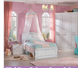
Çilek'ten Selena Genç Odası