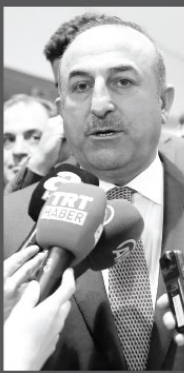
rek şunları söyledi:

Çavuşoğlu, İnterpol'ün merkezini, Çekya ofisinin ve Ankara ofisinin bildirimleri zamanla yaptığını kaydede-