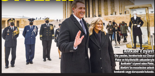
Anıtkabir'e ziyaret Öte yandan, beraberinde eşi Cheryl Flake ve büyükelçilik çalışanlarıyla Anıtkabir'i ziyaret eden Flake, Atatürk'ün mozolesine celenik bırakarak saygı duruşunda bulundu.

ABD'nin Ankara Büyükelçisi Jeff Flake, "Türkiye, NATO'ya sıkı sıkıya bağlı, vazgeçilmez bir müttefik ve sürekli değişimlerin yaşandığı bir bölgede önemli bir ortak. Amerika Birleşik Devletleri ve Türkiye'nin, küresel barış ve güvenliği yönelik çok ciddi tehditlere karşı koymak için birlikte çalışması, ulusal çıkarlarımıza hizmet etmektedir." dedi.