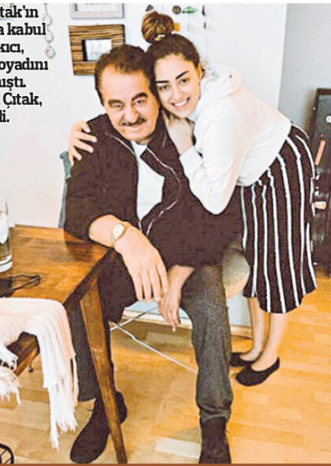
ŞARKICI, 'İbrahim Tatlıses'ten nefret ettiğimizi bir an oldu mu?' sorusu-