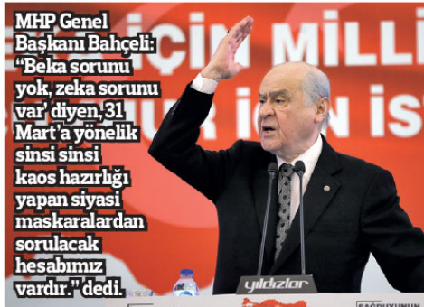
MHP Genel Başkanı Bahçeli: "Beka sorunu yok, zeka sorunu var" diyen, 31 Mart'a yönelik sinsi sinsi kaos hazırlığı yapan siyasi maskaralardan sorulacak hesabımız vardır." dedi.

"İstanbul muazzam bir fethin mirası, muhteşem bir Fatih'in mükaftıdır."