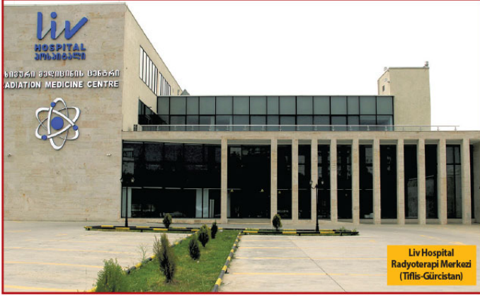
Liv Hospital Radyoterapi Merkezi (Tiflis-Gürcistan)