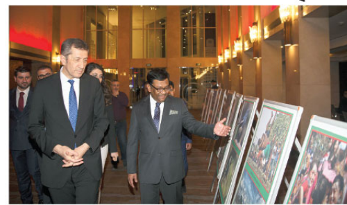
Bangladeş'te 48'inci Bağımsızlık ve Milli Günü dolayısıyla, Bangladeş'te Ankara Büyükelçisi Alama Siddiki'nin (sağda) evsahipliğinde Ankara'da bir otelde resepsiyon düzenlendi. Milli Eğitim Bakanı (MEB) Ziya Selçuk (solda) resepsiyonda açılan sergileri gördü.

Milli Eğitim Bakanı Selçuk, teknoloji, girişimcilik ve inovasyon ekosistemiyle daha fazla alışverişe bulunulmasını gerektiğini dikti katkı çeşerle, şu değerlendirmelerde bulundu: