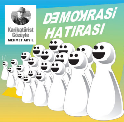
Karikatürist Göziyle MEHMET AKYIL

Müşteri memnuniyeti Artı Tezgâha gelmek BİR DE alışveriş yaparken görünme sikantıyı görme mezlikten geyemeyiz. Çünkü tüketici toplumu dayatması, bir takım psikolojik baskıları da getiriyor. Bir tezgâhtarın malını abartılı övmesi, müşterisini istediği ürünü değil de elde kalmış ürünü pazarlamaya çalışması, yakışmayan tam sana göre diyerek kendisinin inandığı bir olguyu müşterisine zerketmesi ne kadar doğrudur. Müşteri o ürünü alsın bile sonradan akıl ve duygu çatışması içersine girecektir. Daha doğrusu tezgâha geldiğini anlayacaktır. Bu o müesseseye ve o markaya bir itibar kaybı yaşatacağıdır. Müşterinin kızgınlığını ve memnuniyetsizliğini de hesaba katmalıyız.