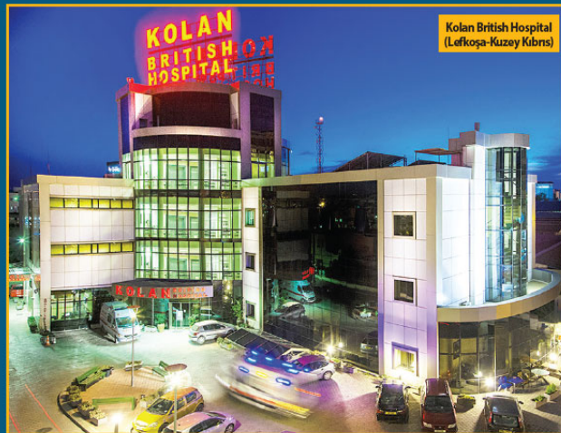
Kolan British Hospital (Lefkoşa-Kuzey Kıbrıs)

Sağlık turizminin gelişimi yönünde daha çok ofis yatırımlarına ağırlık verdik. Arap ülkeleri, Balkanlar ve Türk Cumhuriyetleri öncelikli hedefimiz olmak üzere tüm Avrupa'yı içine alacak şekilde sağlık turizmine yatırım yapmaya devam edeceğiz.