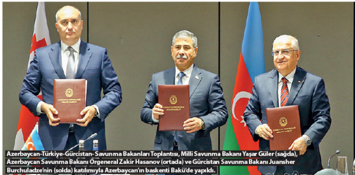
Azerbaycan-Türkiye-Gürcistan Savunma Bakanları Toplantısı, Milli Savunma Bakanı Yaşar Güler (sağda), Azerbaycan Savunma Bakanı Orgeneral Zakir Hasanov (ortada) ve Gürcistan Savunma Bakanı Juansher Burchuladze'nin (solda) katılımıyla Azerbaycan'ın başkentinde Bakü'de yapıldı.

"MONTRÖ SÖZLEŞMESİ İLE HASSAS DENGENİN DEVAM ETTİRİLMESİ GEREKTİĞİNE İNANUYORUZ" Karadeniz'in, Türkiye, Gürcistan ve