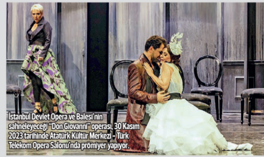
Istanbul Devlet Opera ve Balesi'nin sahneye çeceği "Don Giovanni" operası, 30 Kasım 2023 tarihinde Atatürk Kültür Merkezi - Türk Telekom Opera Salonu'nda prömiyer yapıyor.