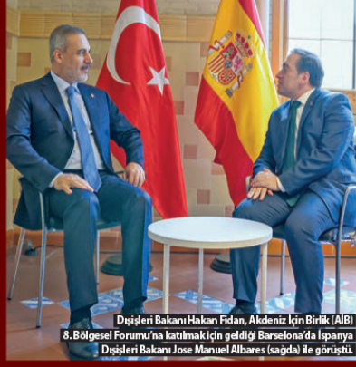
Dışişleri Bakanı Hakan Fidan, Alendiz için Birlik (AİB) 8. Bölgesel Forumuna katılmak için geldiği Barselona'da İspanya Dışişleri Bakanı Jose Manuel Albares (sağda) ile görüşüyor.

Dışişleri Bakanı Hakan Fidan, İspanya'da İrlanda Başbakan Yardımcısı, Dışişleri ve Savunma Bakanı Micheal Martin, İtalya Başbakan Yardımcısı ve Dışişleri Bakanı Antonio Tajani, İspanya Dışişleri, Avrupa Birliği ve İşbirliği Bakanı Jose Manuel Albares ve Hollanda Dışişleri Bakanı Hanke Bruins Slot ile aynı ayın bir araya geldi.