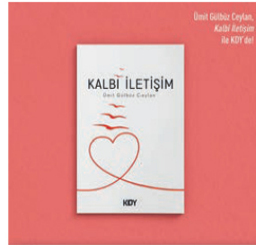
Kitabın yayımlanma için KÖY