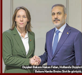
Dışişleri Bakanı Hakan Fidan, Hollanda Dışişleri Bakanı Hanke Bruins Slot ile görüşüyor.

Bakan Micheal Martin, İtalya Başbakan Yardımcısı ve Dışişleri Bakanı Antonio Tajani ve İspanya Dışişleri, Avrupa Birliği ve İşbirliği Bakanı Jose Manuel Albares ile ayrı ayrı görüşmeler gerçekleştirdi.