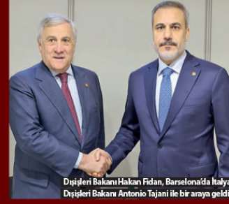
Dışişleri Bakanı Hakan Fidan, Barselona'da İtalya Dışişleri Bakanı Antonio Tajani ile bir araya geliyor.