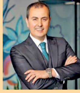
Hakan Aran, İş Bankası Genel Müdürü.

Faiz artırımlarının ardından mevduatın kompozisyonunda önemli bir değişiklik beklendiğini de belirten Aran, "Dolarize olmuş ve yabancı para mevduatın payı çok artmış. Normalleşen politikada yabancı para mevduatın TL mevduata önemli bir dönüş bekliyoruz" diye konuştu.