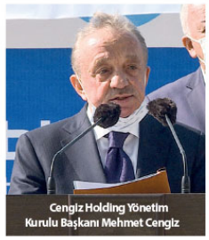
Cengiz Holding Yönetim Kurulu Başkanı Mehmet Cengiz

Boronov, Kırgız-Türk Eti Bakır Terek-Say Şirketi'nin tüm çevresel ve sosyal sorumluluklarına harfeyi uyaacağını söylediğini de dile getirdi. Cengiz Holding Yönetim Kurulu Başkanı Cengiz de Avrupa, Balkanlar ve Türk Cumhuriyetlerinde enerji, inşaat, altyapı ve ulaşım alanlarında önemli projeleri hayata geçirdiklerini belirterek, "Eti Bakır ile maden alanında Kırgızistan'a ilk adımı 2015 yılında attık. Bugün ön çalışmalarını tamamladığımız yatırımı gerçekleştirmenin mutluluğuna yaşıyoruz. Dost ve kardeş ülke Kırgızistan'ın maden yataklarının geliştirilmesi, işletilmesi ve bunun sonucu olarak da Kırgız halkının