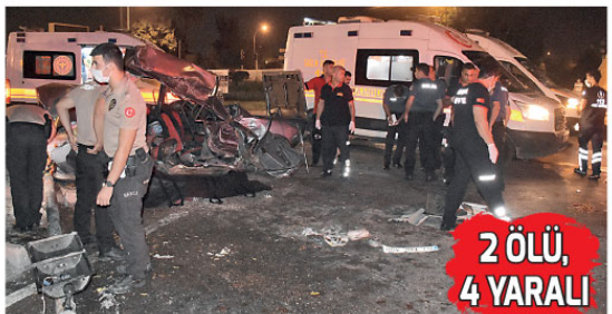
2 ÖLÜ, 4 YARALI

VAN Emniyet Müdürlüğünden yapılan açıklamada, Başkale İlçe Emniyet Müdürlüğü Narkotik Suçlarla Mücadele Grup Amirliği, Narkotik Suçlarla Mücadele Şube Müdürlüğü ile Kaçakçılık ve Organize Suçlarla Mücadele Şube Müdürlüğü görevlilerince Başkale İlçesi Böğrüpek Mahallesi'nde bir ikametinin müstemilatında bulunan depoda arama yapıldığı belirtildi. Narkotik madde arama köpeği Roma'nın da katıldığı detaylı aramada, 2 adet çuval içerisinde 70 paket halinde toplam 35 kilo 833 gram eroin maddesi ele geçirildi. Elde edilen uyuşturucu maddeyle ilgili şüpheli/şüphelilerin kimlik tespiti ve yakalanmasına yönelik çalışmaların devam ettiği belirtildi.