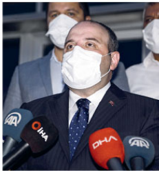
Fatih Toprak ve Adıyaman Üniversitesi Rektörü Mehmet Turgut eşlik etti.

Kovid-19 ile mücadele kapsamında yerli aşı çalışmalarını devam ediyor. Sanayi ve Teknoloji Bakanı Mustafa Varank, "3 aşılı projemizde insan üzerinde gerçekleştirilecek klinik aşama çalışmalarına geldik diyebiliriz. Bunları Türkiye'de ıstıharetle aşı yapmaya sahip bütün şirketlerimiz geçiriyor. Vetal de önemli bir adayımız" dedi.