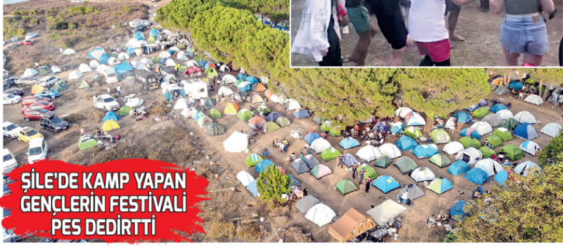
ŞİLE'DE KAMP YAPAN GENÇLERİN FESTİVALİ PES DEDİRTTİ

men edilmiş, 6 sürücüyü alkolü araç kullanmaktan işlem yapılmış, 37 kişiye diğer trafik suçlarından toplamda 34.415 TL idari para cezası uygulanmıştır. İşletmenin ruhsatının bulunmaması sebebiyle Şile Belediyesi Zabıta ekipleri ile irtibatla gecikler iş yeri mühürlenerek kapatılmıştır. Yaklaşık 300 kişiden oluşan şahıslar, yapılan denetimler sonrasında ilçemizden ayrılmışlardır.