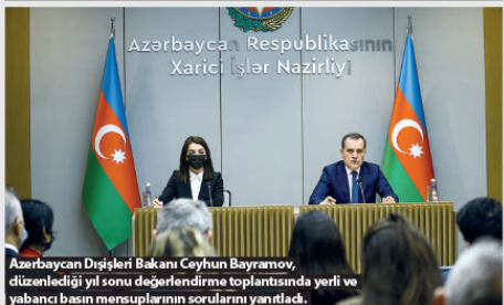
Azerbaycan Dışişleri Bakanı Ceyhan Bayramov, düzenlediği yıl sonu değerlendirme toplantısında yerli ve yabancı basın mensuplarının sorularını yanıtladı.

sının süreklilik, sistemi ve mantık felsefesi üzerinde kurulduğuna, değişen konjonktüre göre farklı tutum sergilemekten, uluslararası hukuk kuralları her konuda farkı yorumlamaktan uzak olduklarını vurgulayarak, "Şeffaf uluslararası hukuku temel alan, ulusal çıkarları gözetilen ve bağimsız dış politikayı yürüten ve yürüteceğiz" ifadelerini kullandı.