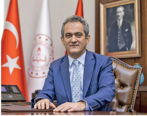
olan 21 ülke arasında, çevre bilinciyle ilgili müfredat değişikliği yapan ilk ülke olmasını kendisini sevindirdiğini kaydetti.

Milli Eğitim Bakanı Mahmut Özer, Ocak 2022 itibarıyla okullarda "Temiz Okul ve Temiz Enerji" projesiyle ilgili çalışmalarını başlatacaklarını, bu kapsamda çevre bilinciyle ilgili çok sayıda modelin okullarda uygulamaya konacağını bildirdi.