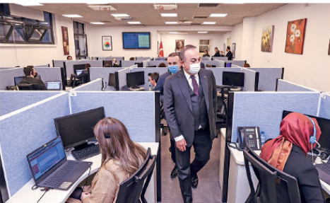
Dışişleri Bakanı Mevlüt Çavuşoğlu, Dışişleri Bakanlığı Konsolosluk Çağrı Merkezi'ni ziyaret ederken, çalışanlar hakkında bilgi aldı.

Üçü şekilde adım da atabiliriz." dedi. Türkiye ve Ermenistan arasında 2009'da ilişkilerin normalleştirilmesine yönelik protokole de değinen Çavuşoğlu, protokolün iyi niyetli bir girişim olduğunu ancak protokolün en önemli kısımların Ermenistan Anayasa Mahkemesi tarafından iptal edilmesi sonucu başarısız olduğunu anmsattı.