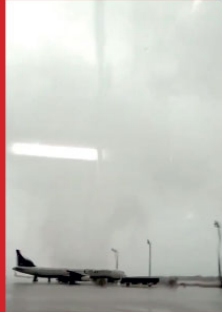
otoparkındaki yaklaşık 100 otomobille hasar oluştu. Hastanede tedavi gören bazı hastalar, yaşanan sorun nedeniyle Antalya'daki hastanelere sevk edildi.

Yaralılarıdan bahçede portakal toplarken kafasına çarpan sert dşim nedeniyle ağır yaralanan Berivan Karakeçili (13) ile hortumun sürüklediği Bayram Demir (40) kaldırıldıktan hastanede yaşamını yitirdi. Demir'in cenazesi Fırka Sahil Kent, Karakeçili'nin cenazesi ise memleketi Şanlıurfa'da toprağa verildi. Berivan Karakeçili'nin ailesiyle mevsimlik tarm işçisi olarak Antalya'ya geldiği, bu yüzden eğitimini yanda bıraktığı öğrenildi.