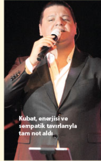
Kubat, enerjisi ve sempatik tavırlarıyla tam not aldı.