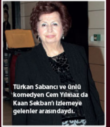
Türkan Sabancı ve ünlü komedyen Cem Yılmaz da Kaan Sekban'ı izlemeye gelenler arasındaydı.