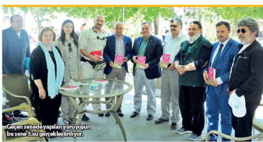
Geçen senede yapılan yürüyüşün bu sene 3.Su gerçekleşti.

dün Kuzey Kutbu'na vardı. Aralarında yalnızca iki tecrübeli kaşifin yer aldığı ekibi Orta Doğu'dan dört, Avrupadan yedi kadın bulunuyordu. Ekip 1'ü Kuzey enlemlerinde kutba doğru yaptıkları zorlu kayak yolculuğunu dün başarıyla tamamladı.