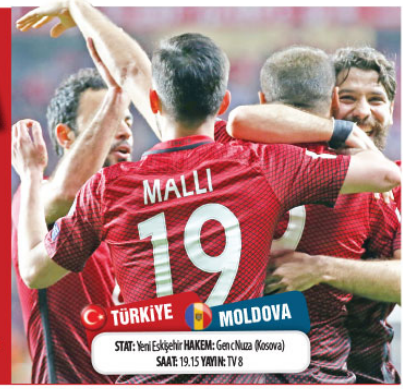
STAT: Yeni Eskişehir HAKEM: Gençliuza (Kosova) SAAT: 19.15 YAYIN: TV 8

ve Samsun'un ardından sahaya çıkacağı 16. yehir olacak. MOLDOVA İLE 9. RANDEVU Türkiye, bugünkü rakibi Moldova ile 9. kez karşı karşıya gelecek. Milliler, şimdiye dek 6'sı resmi, 2'si özel olmak üzere 8 kez karşılaştığı Moldova'ya 6 kez yenerken, 2 kez berabere kaldı, rakibine hiç kaybetmedi. İlki 1996, sonuncusu 2007'de oynanan bu maçlarda 18 gol atan milliler, kalesinde ise sadece 2 gol gördü.