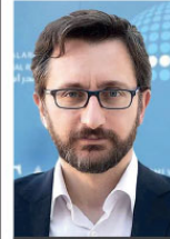
Fahrettin Altun kimdir?

Bu kapsamındaki faaliyetler ile Başkanlığa teklif edilen projelerin değerlendirilmesi ve desteklenen projelerin izlenmesine ilişkin hizmet alanlarında görev alan kamu görevlileri ve hizmetinden yararlanacak diğer kişiler için ilgili mevzuat hükümleri çerçevesinde yapılacak harcamalar Başkanlık bütçesinden karşılanacak.