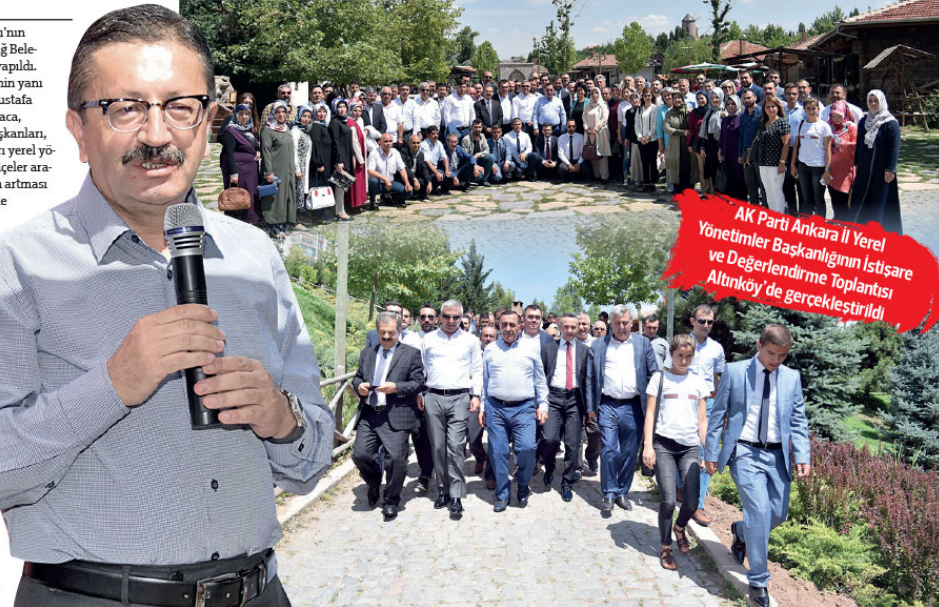
AK Parti Ankara İl Yerel Yönetimler Başkanlığının İstişare ve Değerlendirme Toplantısı Altinköy'de gerçekleştirildi

"Altinköy, yaklaşık 650 bin metrekarelik bir alan üzerinde kuruldu ancak son yapılan eklemelerle 1000 dönüme ulaşacak. Altinköy'ü 5 yılda bugünkü hale getirdik. Buradaki evler 100 yıllık. Ve biz, bu evleri Karadeniz'in orman köylerinden tek tek sökerek, kamyonlarla buraya getirdik. Orada artık bu evlere bakmıyorlardı, fırınlara odun olarak satıyorlardı. 100 yıl öncesinin bir Anadolu köyünde ne ararsanız hepsi Altinköy'de var. Eski köy eşyalarını sergiliyoruz. Onun dışında tarlamız ve hayvanlarımız var. Dalından koparılan sebzeler, sağılan sütler, köy fırınında pişen köy ekmeği, hepsini burada görebilir ve tadabilirsiniz. Altinköy bir Türkiye projesidir."