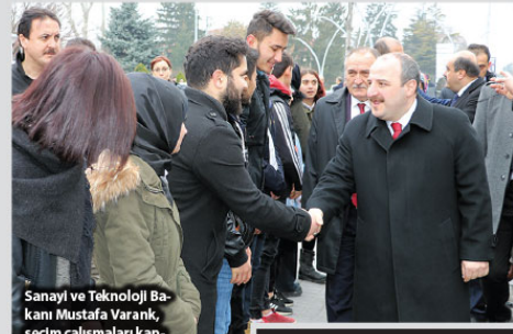
Sanayi ve Teknoloji Bakanı Mustafa Varank, seçim çalışmalarını kapsamında Bolu'ya geldi.

Özsoy, sürecin zorlu geçişine dikkati çekerek, tüm sefer katılımcılarının bu