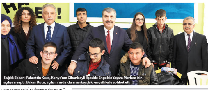
Sağlık Bakanı Fahrettin Koca, Konya'nın Cihanbeyli ilçesinde Engelsez Yaşam Merkezi'nin açılışını yaptı. Bakan Koca, açılış ardından merkezdeki engellilerle sohbet etti.

Koca, yeni dönemde hem ülke genelinde hem de Kulu'da hizmete hız kesmeden devam edeceklerine işaret ederek, sözlerini şöyle sürdürdü: "Önemli olan bu dönemde milletimizin gönlüne girebilmek olmalı. Yani sizlerin gönlüne yer etme edilebilir olmalı. Milletin teveccühüne mazhar olabilmek önemli. Halka ve Hakk'a karşı mahcup olmamak önemli. Emanetine sahip çıkmak önemli. Vatandaşlarımızın talep ve ihtiyaçları doğrultusunda nitelikli sağlık hizmeti verme gayretindeyiz. Yeni dönemde 82 milyon vatandaşımıza hakkaniyetli, kaliteli ve nitelikli sağlık hizmetini sürdürülebilir kılmayı kendimize hedef koyduk. Özellikle sağlık alanında, sağlık turizminin de merkezi olan şehir hastanelerini, bölgenin sağlık