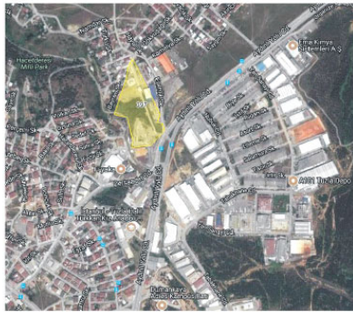
Aydınlı Mahallesi 3 Pafta 397 Parsel