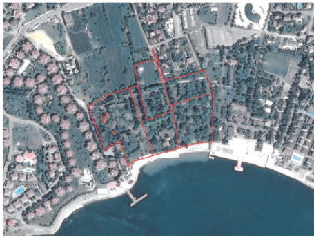
Merkez Mahallesi 7 Pafta 1009 Parsel, 8 Pafta 1010, 1022, 3059, 3234 Parseller