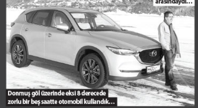
Donmuş göl üzerinde ekli 8 dereceye zorlu bir beş saatte otomobil kullandı...