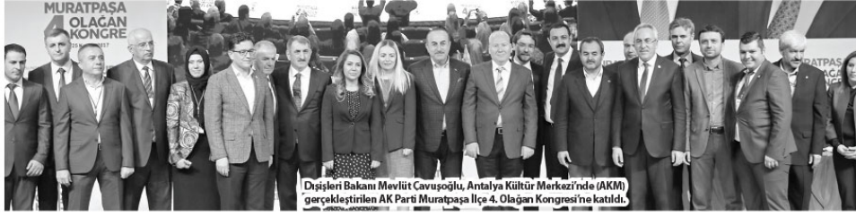
Dışişleri Bakanı Mevlüt Çavuşoğlu, Antalya Kültür Merkezi'nde (AKM) gerçekleştirilen AK Parti Muratpaşa İlçe 4. Olağan Kongresi'ne katıldı.