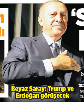
Beyaz Saray: Trump ve Erdoğan görüşecek