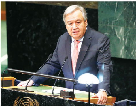
Birleşmiş Milletler (BM) 73. Genel Kurulü Görüşmeleri 140'tan fazla devlet ve hükümet başkanının katılımıyla başladı. Toplantıda, BM Genel Sekreteri Antonio Guterres bir konuşma yaptı.