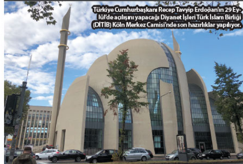
Türkiye Cumhurbaşkanı Recep Tayyip Erdoğan'ın 29 Eylül'de açılışı yapılacak Dışişleri İşleri Türk İslam Birliği (DİTİB) Köln Merkez Camisi'nde son hazırlıkları yapıyor.

Son olarak Rusya ile birlikte imzaladığımız Soçi Mutabakatıyla rejiminin 3,5 milyon sivilin yaşadığı İdilbi Çatışmasızlık bölgesine yönelik kanlı saldırıların önüne geçtik. Daha önce Halep, Hama, Humus, Dera ve Doğu Guta'da yaşanan katliamların İdilbi'de tekrarlanmasını engelleyerek Suriye'de barışa ve siyasi çözüme giden yolu açık tuttuğumuzuz inanıyoruz. Hedefimiz, Menbiç'ten başlayarak Irak sınırına kadar olan Suriye topraklarının tamamını teröristlerden temizlemektir."