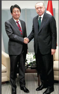
Türkiye Cumhurbaşkanı Recep Tayyip Erdoğan, Japonya Başbakanı Şinzo Abe ile görüşti.

"Bu örgüt zaman içinde ülkemizde sahip olduğu ekonomik ve bürokratik gücü, devletle birlikte siyaseti ve toplumu kontrol altına almak için kullanmaya