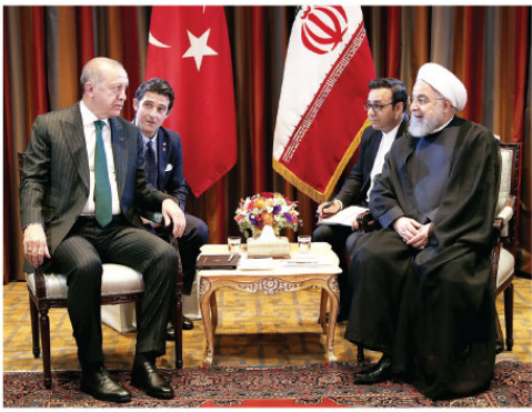
Birleşmiş Milletler (BM) 73. Genel Kurulü görüşmelerine katılmak üzere ABD'nin New York kentinde bulunan Türkiye Cumhurbaşkanı Recep Tayyip Erdoğan, İran Cumhurbaşkanı Hasan Ruhani ile görüşüyor.