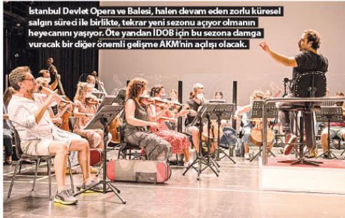
İstanbul Devlet Opera ve Balesi, halen devam eden zorlu küresel salgın süreci ile birlikte, tekrar yeni sezonu açıyor olmanın heyecanını yaşıyor. Öte yandan İDOB için bu sezonda damga vuracak bir diğer önemli gelişme AKM'nin açılışı olacak.

Sezon açılışı 1 Eylül 2021'de "FIDELIO" Operası ile gerçekleşiyor. Eser, 18.yy'da İspanya'da bir hapisteneden geçer. Siyasi rakibi olan, kötü adam Don Pizarro tarafından gizlice hapsedilen kocası Florestan'ı kurtarmak için, "Fidelio" takma adı ile, erkek gardiyanı kağına gren Leonore adı bir kadın konu edilir.