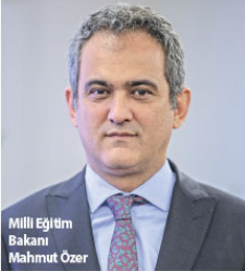
Milli Eğitim Bakanı Mahmut Özer

"Milli Eğitim camiamız olarak, son dönemde art arda yaşadığımız iki büyük felaketin yaralarını sarmaya, izlerini silmeye elimizdeki tüm imkanlarla