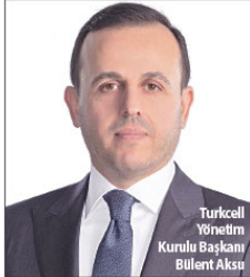
Turkcell Yönetim Kurulu Başkanı Bülent Aksu

devam ediyoruz. Bu bölgede yaşayan ve 6 Eylül'de okullarına kavuşturmak için gerekli çalışmaların yapıldığını ve eğitim öğretim yılının başlamasına yönelik çalışmaların hızla ilerlediğini belirttik. Okulların açılmasıyla birlikte afet bölgelerinde eğitim gören öğrenci ve öğretmenlere 10 bin adet tablet dağıtılacak. Bu vesileyle Turkcell Yönetim Kurulu Başkanı Sayın Bülent Aksu'nun