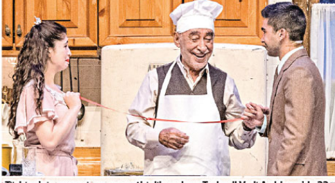
Türkiye'nin en yeni, en genç etkinlik mekanı Türkcell Vadi Açık hava'da 22 Ağustos - 24 Eylül arası popüler tiyatroyu sahnelenmeye başlıyor.