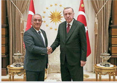
Türkiye Cumhurbaşkanı Recep Tayyip Erdoğan, Cumhurbaşkanlığı Külliyesi'nde DSP Genel Başkanı Önder Aksofka'nı kabul etti.

Cumhurbaşkanı Recep Tayyip Erdoğan, Türkiye-Azerbaycan Yüksek Düzeyli Stratejik İşbirliği Konseyi'nin 8'inci Toplantısı dolayısıyla bugün Azerbaycan'a resmi ziyaret gerçekleştirecek. İletişim Başkanlığından yapılan açıklamaya göre, konsey toplantısı Cumhurbaşkanı Erdoğan ile Azerbaycan Cumhurbaşkanı İlham Aliyev'in başkanlığında, ilgili bakanların katılımıyla Bakü'de yapılacak. Konsey toplantısında