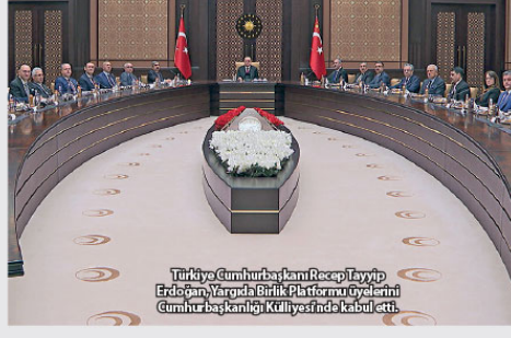
Türkiye Cumhurbaşkanı Recep Tayyip Erdoğan, Yüksek Düzeyli Stratejik İşbirliği Konseyi'nde DSP Genel Başkanı Önder Aksofka'nı kabul etti.

yapılacak görüşmelerde, Türkiye-Azerbaycan ilişkileri tüm boyutlarıyla gözden geçirilecek ve iki ülke arasındaki birliğin daha da derinleştirilmesi imkanları ele alınacak. Temaslarda, ikili ilişkilerin yanı sıra bölgesel ve uluslararası meseleler hakkında fikir teatisinde bulunulması da öngörüldü. Toplantı vesilesiyle, ikili ilişkilerin ahdi zeminine önemli katkılar sağlayacak muhtelif anlaşma ve mutabakat metinlerinin imzalanması da gündemde yer alıyor.