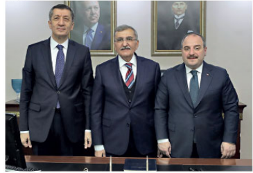
inceleme başlatık. Aksi de olabilir, eşit de çizilebilir. Bu yapılan, kitapları incelemeyen bürokrasinin

ilişkin soruları yanıtladı. Birinin söylediği bir sözün içeriğe bakılmadan büyütüldüğünü, gereksiz zaman ve enerji harandığını belirten Selçuk, şunları kaydetti: "Kitabın içeriğini tek tek inceledim. Öncelikle çocuğun gördüğü bir kitap değil. UNICEF ile hazırlanan ve 7 ayrı kitaptan oluşan sette son derece yararlı içerikler var. İçinde başı açık anneler de var, başı açık ve kapalı annelerin bir arada olduğu çizimler de var. Genellikle pozitif örnekler bulunuyor, 150'nin üzerinde resimden sadece ikisinde olumsuz örnek çizim var, ikisi de başı açık çizilmiş. Eğer kastılı ise bunu onaylamamız söz konusu olamaz. Nitekim