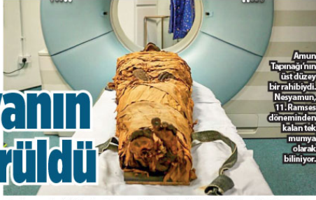
Amun Tapınağı'nın üst düzey bir rahibiydi, Nesyamun, 11. Ramses döneminden kalan tek mumya olarak biliniyor.

İngiltere'de bilim insanları, 3 bin yıl önce mumyalanmış Mısırlı bir rahibin sesini yapay ses teknolojisiyle hayata döndürmeyi başardı.