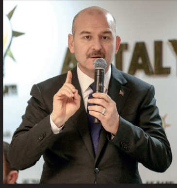
Soylu, "Bu yıl 454 bin kaçak göçmen yakalandı, bunlardan 104 bin kişi kendi ülkelerine gönderildi. Yüzlerce insan Ege Denizi'nde boğulmaktan

Sahada ortaya konulan başarının tesadüf olmadığını, büyük bir disiplin, gelenek ve yüksek bütçelerin ürünü olduğunu bildiren Bakan