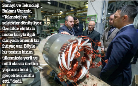
Sanayi ve Teknoloji Bakanı Varank, "Teknoloji ve sektörler dönüştürüyor. Özellikle elektrik motorlarıyla ilgili dünyada önemli bir ihtiyaç var. Böyle bir tesisin bizim ülkemizde yerli ve milli olarak üretimin yapılması beni gerçekten mutlu etti" dedi.

Bakan Varank, GAMAŞ ziyaretinde yaptığı konuşmada, GAMAŞ Motor'un Türkiye'de elektrik motoru üretimin, kökleri bir geçmişli olan üretim tesislerinden bir tanesi olduğuna dikkatli çekerek, "Buradaki elektrik motorlarının yerlilik oranları yüzde 70-90 arasında değişiyor ve bu tesiste son teknoloji yüksek verimli elektrik motorları üretilebiliyor. Elektrik motorları, sanayinin tamamında kullanılan temel bileşenlerden bir tanesidir. Makine teçhizatımızın içinde, diğer sanayi