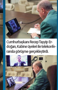
Cumhurbaşkanı Recep Tayyip Erdoğan, Kabin üyeleri ile telekonferansla görüşme gerçekleştirdi.