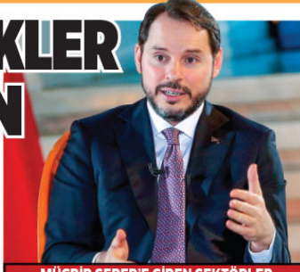
MÜCBİR SEBEP'E GİREN SEKTÖRLER

Hazine ve Maliye Bakanı Berat Albayrak, "Koronavirüs ile mücadelede kahramanlarımız, sağlık çalışanlarımızın talepleri önceliğimiz olacak." dedi. Albayrak ayrıca, 1,9 milyon vatandaşın mücbir sebep hali kapsamına alındığını söyledi.