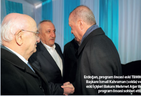
Erdogan, programı öncesi eski TBBM Başkanı İsmail Kahraman (sola) ve eski İçişleri Bakanı Mehmet Ağar ile program öncesi sohbet etti.

Bizim adayımız Kayseri Büyükşehir Belediye Başkanlığı yapmış olan, bakanlık yapmış olan, yerel yönetimlerden sorumluluğu olan Genel Başkan Yardımcısı Mehmet Özhaseki kardeşimizi aday gösterdik. CHP İzmir'e de kenar