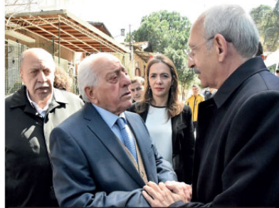
CHP Genel Başkanı Kemal Kılıçdaroğlu, Şehit Jandarma Komando Murat Yüksel'in Büyükşehir'de yaşayan ailesini ziyaret etti.

Anadolu'nun pek çok noktasından insanların yaşamak için Adalar'a geldiğini anlatan Kılıçdaroğlu, "Onlarla beraber bir huzur ve barış ortamı yaratıldı. Kimsede itkiçlikli. Kimsede fark bir şey söylenmedi. Herkes kucaklaştı. Kucaklaştırmak