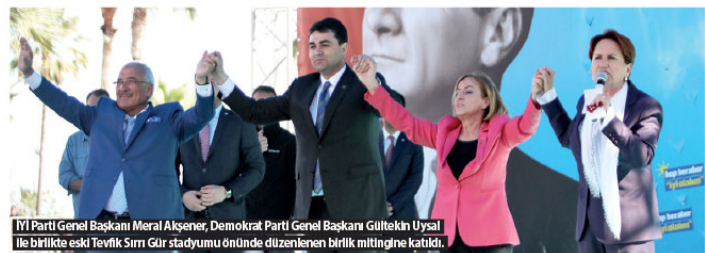
İYİ Parti Genel Başkanı Meral Akşener, Demokrat Parti Genel Başkanı Gültekin Uysal ile birlikte eski Tevrik Sırm Gür stadyumunu önünde düzenlenen birlik mitingine katıldı.

Kılıçdaroğlu, sivil toplum kuruluşları ve kanaat önderleri buluşması için geldiği Büyükşehir'de da 1995'te şehit olan Yüksel'in ailesinin evine gitti.