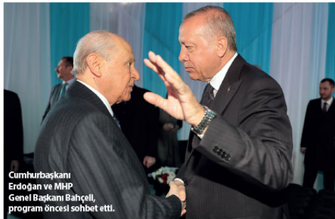
Cumhurbaşkanı Erdoğan ve MHP Genel Başkanı Bahçeli, program öncesi sohbet etti.

Ciham adaletle kavrayan tarihe silinmez ve eserler buradan aziz ecdadımız gelerek ülkelerini İstanbul'da bulmuştu. Bu nedenle İstanbul, Cumhur İttifakı'nın hassasiyet ve haysiyet merkezidir. İstanbul'dan atılacak bir adımı yankısı her taraftan işitilecektir. Cumhur İttifakı olarak bunun bilincindeyiz. Ne var ki zalimler boş durmuyorlar. Türk ve İslam düşmanları çevremizde vızır vızır geziyorlar. 15 Mart 2019 günü Yeni Zelanda'da Cuma namazı esnasında iki camiye hunharca saldırı düzenlendi. Maalesef 51 din kardeşimiz şehit edildi, 47 din kardeşimiz de yaralandı. Alçak teröristler 630 yıl önceki Kosova Savaşı'nın kinini tutuyorlar. 330