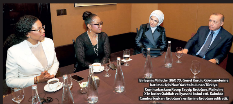
Birleşmiş Milletler (BM) 73. Genel Kurulu Görüşmelerine katılmak için New York'ta bulunan Türkiye Cumhurbaşkanı Recep Tayyip Erdoğan, Malkolm X'in kızları Qabilah ve İlyasah'ı kabul etti. Kabulde Cumhurbaşkanı Erdoğan'a eşi Emine Erdoğan eşlik etti.

"Yazma son verirken Rusya ile ilişkilerimizin son dönemde iyi komşuluk, ortak çıkarlar ve karşılıklı saygı çerçevesinde gelişmeye devam ettiğini duyduğumuz memnuniyetle de ayrıca ifade etmek istiyorum. Ortak projeleri ve karşılıklı yatırımlar başta olmak üzere, insanî ve kültürel ilişkilerimizin de gelişmesi için gerekli adımları atıyoruz. Bundan sonra da bu adımları atmaya devam edeceğiz. Aynı coğrafyayı paylaşan ve yüzyıllar boyunca tarihin öznesi olmayı başarmış olan Türk ve Rus halklarının derin, samimi ve yakın bir ilişki içinde olması gerektiğini inanıyoruz. Bu amaç doğrultusunda yapılan çalışmalar her zaman destekleyeceğimiz vurgulamak istiyorum."