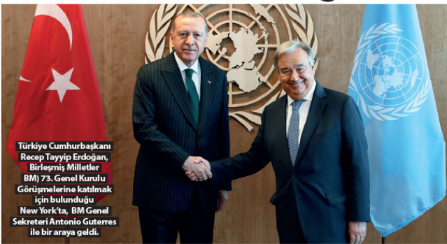
Türkiye Cumhurbaşkanı Recep Tayyip Erdoğan, Birleşmiş Milletler (BM) 73. Genel Kurulu Görüşmelerine katılmak için bulunduğu New York'ta, BM Genel Sekreteri Antonio Guterres ile bir araya geldi.

Cumhurbaşkanı Recep Tayyip Erdoğan, BM 73. Genel Kurulu Görüşmelerine katılmak üzere bulunduğu New York'ta BM Genel Sekreteri Antonio Guterres ile bir araya geldi.