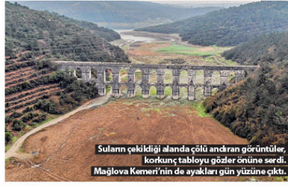
Suların çekildiği alanda çölu andran görüntüler, korkunç tabloyu gözler önüne serdi. Mağlova Kemer'i'nin de ayakları gün yüzüne çıktı.

10 yılına bakıldığında en düşük doluluk oranı Aralık 2013 yılında yüzde 20.31 ölçülürken bu rakam bugün itibarıyla yüzde 30.78 olarak kayda geçti. Suların büyük kısmının çekildiği barajın son durumu ise havadan drone kamerası ile görüntüldü. Görüntülerde suların çekildiği alanda oluşan kuraklık korkunç tabloya bir kez daha gözler önüne serdi. Suların çekilmesi ile birlikte Mimar Sinan tarafından 1554-1562 yılları arasında Alibey Deresi yüzeyi üzerinde yapılmış olan Mağlova Kemer'i'nin de ayakları yitice görünmeye başladı.