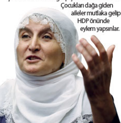
Çocukları dağda gelen ailelerin mutaka geldiği HDP önüne yapışınlar.

rum" dedi. HDP'nin önünde eylem yaparken çocukları dağa kapılan Anne ve babaları da yanında olmasını bekledikleri dile getiren Akar, şöyle devam etti: "Ailelere de tavsiyem çocukları dağa kaçırıldığında gidip HDP önünde oturup eylem yapınlar. Benim diğer oğlum da onları kandırmış kaçırıldı ve öldürüldü. Övden sonra 40 gün yeme içmeden kesildim bana böyle bir acı yaşattılar. Çocukları kapılan aileler, Anne ve babalar korkmasın cesaretle bir şekilde HDP önüne gidip çocuklarını istesinler."