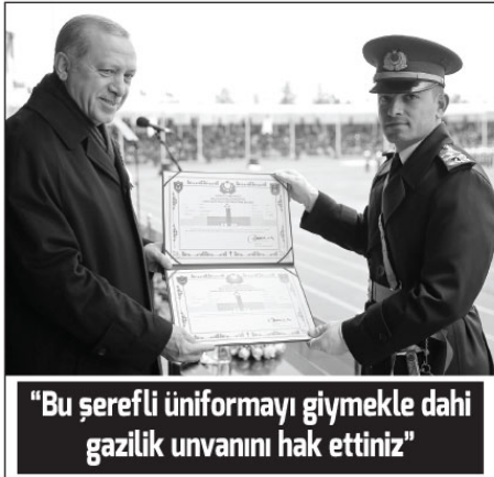
"Bu şereflî üniformayı giymekle dahi gazilik unvanını hak ettiniz"

Ortaylı'nın hikayesini, "Bir savaş sırasında İtalyan kumandan askerlere ne ateş emri verir. Kimse ateş etmeyince kumandan 'ateş, ateş, ateş' diyerek hararetili bir şekilde bağırıyor ya başlar. Bu sırada siperdeki askerlerden biri 'bu ne güzel ses' diyerek