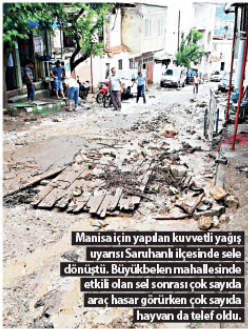
Manisa için yapılan kuvvetli yağış uyarısı Saruhanlı ilçesinde sele döniştü. Büyükşehir Belediyesi Mahalleli'de etkili olan sel sonrası çok sayıda araç hasar gördükten çok sayıda hayvan da telef oldu.