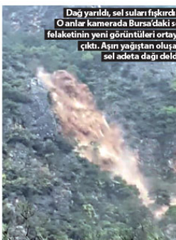
Dağ yarıldı, sel suları fıskırdı... O anlar kamerada Bursa'daki sel felaketinin yeni görüntüleri ortaya çıktı. Aşın yarılardan oluşan sel adeta dağı deldi.