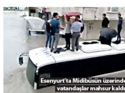
İzmir'de dün sabah saatlerinde aniden bastıran sağanak yağış, günlük hayatı olumsuz etkilerken birçok ev ve işyerini de sular altında bıraktı.

İlçede oluşan hortum nedeniyle bazı binalarda hasar meydana geldi. Çatalca yolundaki bir duble evin çatısının uçtuğu, bahçesindeki ağaçların koptuğu, bahçe çitlerinin devrildiği gözlendi. Ayrıca, şiddetli rüzgar nedeniyle evin içindeki elektrik direği de devrildi.