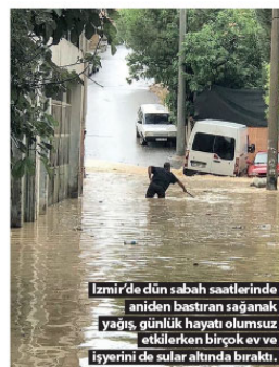
İzmir'de dün sabah saatlerinde aniden bastıran sağanak yağış, günlük hayatı olumsuz etkilerken birçok ev ve işyerini de sular altında bıraktı.