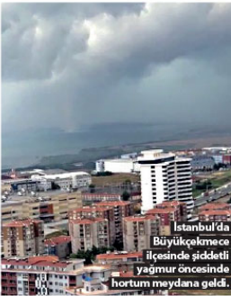
İstanbul'da Büyükşehir Belediyesi Mahalleli ilçesinde şiddetli yağmur öncesinde hortum meydana geldi.