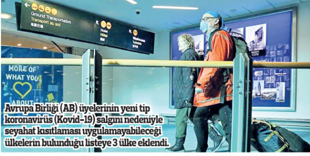
Avrupa Birliği (AB) üyelerinin yeni tip koronavirüs (Kovid-19) salgını nedeniyle seyahat kısıtlaması uygulamayabileceği ülkelerin bulunduğu listeye 3 ülke eklendi.