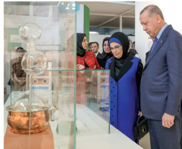
Türkiye Cumhurbaşkanı Recep Tayyip Erdoğan ve eşi Emine Erdoğan, İstanbul Havalimanı'nda Modern Bilimin Öncüleri İslam Bilim ve Teknoloji Tarihi Sergisi'nin açılışını yapıyor.