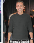
Mustafa Sandal: Polat Yağcı'nın şov dünyasına girenken ilk yaptığı iş, bir Mustafa Sandal konseriyim.