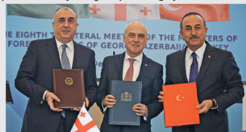
Türkiye-Gürcistan-Azerbaycan Dışişleri Bakanları Toplantısı'nda Dışişleri Bakanı Mevlüt Çavuşoğlu (sağda), Gürcistan Dışişleri Bakanı David Zalkalani (ortada) ile Azerbaycan Dışişleri Bakanı Elmar Memmedyarov (solda) katıldı.

Türkiye'nin, "Libya'daki tek meşru temsilci" olarak kabul edilen Ulusal Mutabakat Hükümeti (UMH) ile imzaladığı mutabakatı hatırlatan Çavuşoğlu, şöyle devam etti: Libya 2018'de İtalya, 2019'da ABD, 2018 ve 2019'da AB, 2019'da da Nijer ile benzer mutabakat mühtaralan imzalamışken Türkiye ile imzaladığı mutabakatın neden yasa dışı olduğunu anlatılabilmiz? Libya kanunlarına göre anlaşmanın geçerlilik kazanması için UMH Başkanlık Konseyi tarafından onaylanması gerekiyor ki bu süreç tamamlanmadı. Dolayısıyla mutabakat yasal ve geçerlidir. Libya'daki siyasi sahne herhangi bir değişiklikle Türkiye'nin tezini etkilemeyecektir.