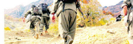
3 binden fazla terörist etkisiz hale getirildi

Harekatın Cerablus ayında da ilerleme devam ederken 12'nci güne gelindiğinde ÖSO güçleri, TSK'nın desteğiyle Çobanbey ve Cerablus arasındaki Suriye-Türkiye sınırında, terörist unsurlarından arındırılmış bir kuşak meydana getirdi. Türkiye sınırından Suriye içine doğru 3 ila 5 kilometre derinliğe sahip güvenli kuşak, DEAŞ'ın Türkiye sınırları ile doğrudan fiziki temasını ortadan kaldırdı. ÖSO'nun terör örgütleri DEAŞ'tan ve PKK/PYD/YPG'den kurtardığı alan 600 kilometrekareye yükseldi.