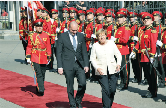
"Gürcistan'ın toprak bütünlüğünü destekliyorum"

Gürcistan Avrupa ilişkilerine değinen Bahladze, "Biz Avrupa'ya doğru dikkatle adımlar atıyoruz. Bizim için Almanya ile ilişkiler çok önemli. Merkel hanımın Gürcistan'a gelişini bizim Avrupa'ya atılmış adımlarda büyük katkıları" şeklinde konuştu.