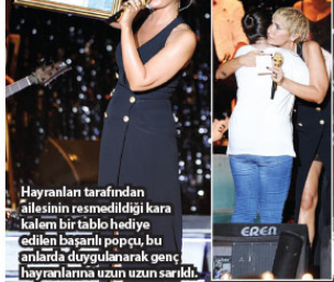
Hayranları tarafından ailesinin resmedildiği kara kalem bir tablo hediye edilen başarılı popçu, bu anlarda duygulanarak genç hayranlarına uzun uzun sarıldı.

yok ne varsa dışında dedim. Doktorum "istirahat etsen iyi olur" dedi. Lakin bu gece için hepimizle haftalar öncesinden sözleştik. Aramızda cep harçlığından tasarruf edip bilet alan kardeşlerimiz var biliyorum. Bu bile benim bu sahnedeki olmam gerektiğini özeliyor aslında... Burada bu sahnedeki olmam kendimi daha kötü hissederdim inanım. Bu gece ufak tefek, küçük hatalarım olursa af buyurun olur mu?" sözleri ile selamlayan Sila, alanı dolduran binlerce kişi tarafından tezahüratlar eşliğinde dakikalarca alkışlandı.