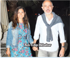
Ash Etilip İkibakar

BAŞARILI rapçi Ceza Kurban Bayramı'nın ikinci gününde Bodrum'un sevilen mekanları arasında yer alan Jungle 8'de muhteşem bir performansla imza attı. Ceza "Ne De Zor" şarkısıyla kendisini dinlemeye gelenleri selamlarken şarkı arasında "Hepiniz hoşgeldiniz. Şimdi hepimizin bildiği bir şarkıyı söyleyeceğim. Hepinizin eşlik etmesini istiyorum. Bu arada bayramınız da kutlarm." sözleriyle "Suspuz" şarkısını söyledi. Ceza bu şarkıda kalabalığı ayağa kaldırdıktan tüküm tüküm dolan Jungle 8 şarkıyı hep bir ağızdan koro halinde söyledi.