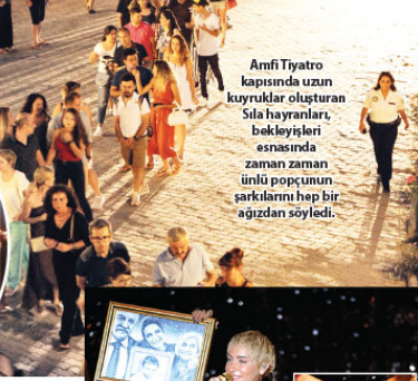
Amfi Tiyatro kapsamında uzun kuyruklar oluşturan Sila hayranları, bekleyişleri esnasında zaman zaman ünlü popçunun şarkılarını hep bir ağızdan söyledi.

'O'n'dan Kalkan Şarkılar' konseptiyle büyük beğeni toplayan ve çıktığı Ege Turnesinde on binlerce kişiyi konser alanlarına taşımaya başaran başarılı popçu Sila, öncesi ve sonrasıyla Kuşadası Amfi Tiyatro'da tam anlamıyla iz bıraktı. Biletleri günler öncesinden tükenen konser için etkinlik günü organizasyon yetkilileri tarafından satışa sunulan ek kontenjan biletleri de dakikalar içinde tükendi. Etkinlikten saatler önce Amfi Tiyatro kapısında uzun kuyruklar oluşturan Sila hayranları, bekleyişleri esnasında zaman