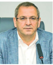
Mesut ERGİN AYVALIK BELEDİYESİ BAŞKANI

"Fırtına nedeniyle 56 özel, 10 gezi teknesi, 14 profesyonel balıkçı ruhsatlı balık teknesi tamamen zarar gördü. Teknelerde yaklaşık 50 milyon liralık maddi hasar oldu. Ana arter-