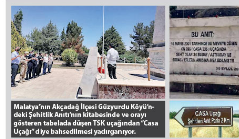
Malatya'nın Akçadağ İlçesi Güzyürdu Köyü'ndeki Şehitlik Anıtı'nın kitabesinde ve orayı gösteren tabelada düşen TSK uçağının "CASA Uçağı" diye bahsedilmesi yadigarıdır.

Bir İspanyol markası olan EADS-CASA hafif nakliye uçağın Endonezya'daki IPTN firmasının yanı sıra Türkiye'de de TAI (Turkish Aerospace Industries) TUSAŞ tarafından da imal edilmektedir. Şu ana kadar 300'den fazla üretilen bu uçağın birim maliyeti 60 milyon dolar civarında. İspanya, Endonezya, Azerbaycan ve Gü-