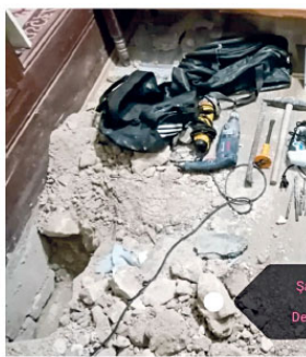
Şahinbey İlçe Emniyet Müdürlüğü Devriye Ekipleri Amirliği

NARKOTİK Suçlarla Mücadele Şube Müdürlüğü tarafından uyuşturucu veya uyuşturucu madde ticareti yapan şahıslara yönelik operasyon düzenlendi. İl genelinde uyuşturucu ticareti yaptıkları tespit edilen toplam 48 şahıs yakalanarak gözaltına alındı. Yakalanan şahısların üzerinde, ikametlerinde ve aralarında yapılan aramalarda 11 kilo 100 gram metamfetamin, 4 kilo 400 gram kokain, 3 kilo 600 gram bonzai, 3 kilo 600 gram esrar, 39 adet ecstasy, satış hazır halde paketlenmiş bir miktar eroin, 1 adet hassas terazî, 10 adet ruhsatsız tabanca ve bu tabancalara alt 29 adet fişek, 2 adet ruhsatsız tüfek ve uyuşturucu madde ticaretinden elde edildiği tespit edilen bir miktar para ele geçirildi. Yapılan çalışmalar neticesinde yakalanan 48 şahstan 33'ü çankırıdan mahkemeye tutuklanırken, 15 şahıs hakkındaki adli tahkikat devam ediyor.