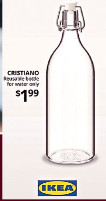
CRISTIANO Reusable bottle for water only $199

IKEA, Ronaldo'nun Portekiz- Macaristan maçı öncesi Cola Cola'nun hisselerinin çakılmasına sebep olan hareketini bir reklam fırsatına dönüştürdü ve 'Ronaldo' adını verdiği su şişelerini satışa çıkardı.