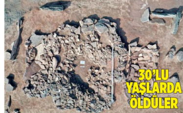
30'LU YAŞLARDA ÖLDÜLER

RUSYADA Novosibirsk Devlet Üniversitesi'nden arkeologlar Sibiry'a'nın güneyinde 2 bin 500 yıl önce olduğu düşünülen savaş aletleri ile birlikte gömülen bir çiftin mezarını ortaya çıkardı. Kadın ve erkeğin kemiklerinin yanı sıra mezarlıkta bir bebek ve yaşlı kadının da kalıntıları bulundu. Araştırmacılar, bebekleri ve hizmetkarlarıyla birlikte gömülen çiftin, İskit medeniyetinin bir parçası olan Tağar kültüründen olduğunu düşündüklerini açıkladı.