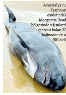
Avustralya'nın Tazmanya eyaletindeki Macquarie Heads bölgesinde sığ sularda mahsur kalan 270 balınadan en az 90'ü öldü.

BBC'nin haberine göre, Tazmanya Denizcilik Koruma Programı görevlilerin pazarlığı gecesinden bu yana çalışmalarını sürdürdüğü bölgede 270 balinanın üçte biri can verdi. Yaklaşık 40 kişiden oluşan kurtarma ekibinin öte yandan 25 balınaya sığ sulardan çıkarmayı başardığı, daha fazlasına açık denize kadar eşlik etmeyi amaçladığı belirtildi. Balinalar Macquarie Heads bölgesinde 3 grup halinde bulunmuştu.