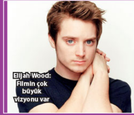
Elijah Wood: Film için çok büyük vizyonu var