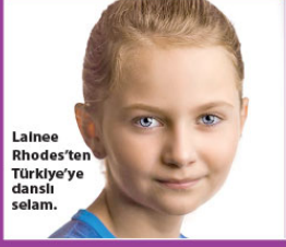
Laine Rhoades Türkiye'ye dansli selam.