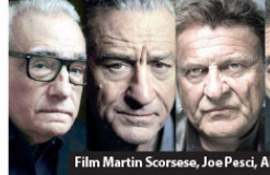
Film Martin Scorsese, Joe Pesci, Al Pacino ve Robert De Niro'yu bir araya getiriyor.

oynayan ünlü aktör aslında 1.71 boyunda olunca çareyi dev platformlu topuklu ayakkabılarda buldu. İngiliz basınından Daily Mail ise bu görüntülerin ardından ünlü aktöre, "Ayakkabılardan innemek için asansöre gerek var mı?" yorumunu yaparak takıldı. Vizyon tarihi henüz belli olmayan "The Irishman" 1980'de Raging Bull'da, 1990'da Good Fellas'ta ve 1995'te Casino'da birlikte çalışan Martin Scorsese, Joe Pesci, Al Pacino ve Robert De Niro'yu bir araya getiriyor. Ayrıca, Variety dergisine göre, Robert De Niro'nun Netflix'in rakibi Amazon'da yayınlanacak olan David O. Russell'in yeni TV dizisinin bölüm başına 775.000 $ kazanacağı ortaya çıktı.