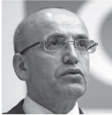
Kararname tasarımlarını Başbakanlığa gönderdiklerini söyledi.

Başbakan Yardımcısı Şimşek, "Daha fazla tarımsal üretici, esnaf ve sanatkarlarımızın uygun koşullarda kredi faiz desteğinden yararlanmasını sağlamaya çalışacağız"