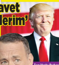
Tom Hanks Başkan Trump'ın davetini reddedeceğini açıkladı.

Ocak ayında gösterime girecek 'The Post' filmi, Washington Post gazetesinin efsanevi eski genel yayın yönetmeni Ben Bradlee'nin 1971'de Vietnam Savaşı ile ilgili devlet sırlarının ifşasını içeren Pentagon Belgeleri'ni yayımlamasından ardından dönem ABD Başkanı Richard Nixon tarafından tehdit edilmesini konu alıyor.