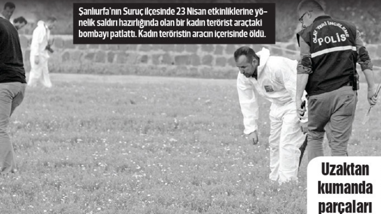
Şanlıurfa'nın Suruç İlçesinde 23 Nisan etkinliklerine yönelik saldırı hazırlığında olan bir kadın terörist aracıyla bombayı patlattı. Kadın teröristin aracın içerisinde öldü.

Suruç Devlet Hastanesi yakınlarında bombalı araçla saldırı düzenlendi. Olayda saldırgan ölü olarak ele geçirildi. Mezarlık yakınında gerçekleştirilen patlamanın etkisiyle mezarlığın dış cephe duvarının yıkıldığı ve patlayan aracın büyük oranda zarar gördüğü görüldü.